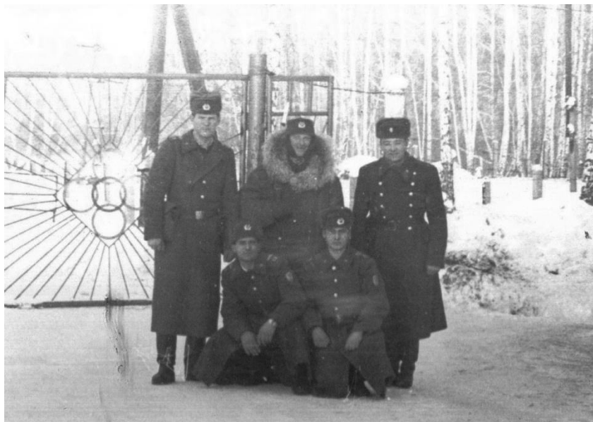
Служба в Советской Армии. 1982 год, г. Новосибирск