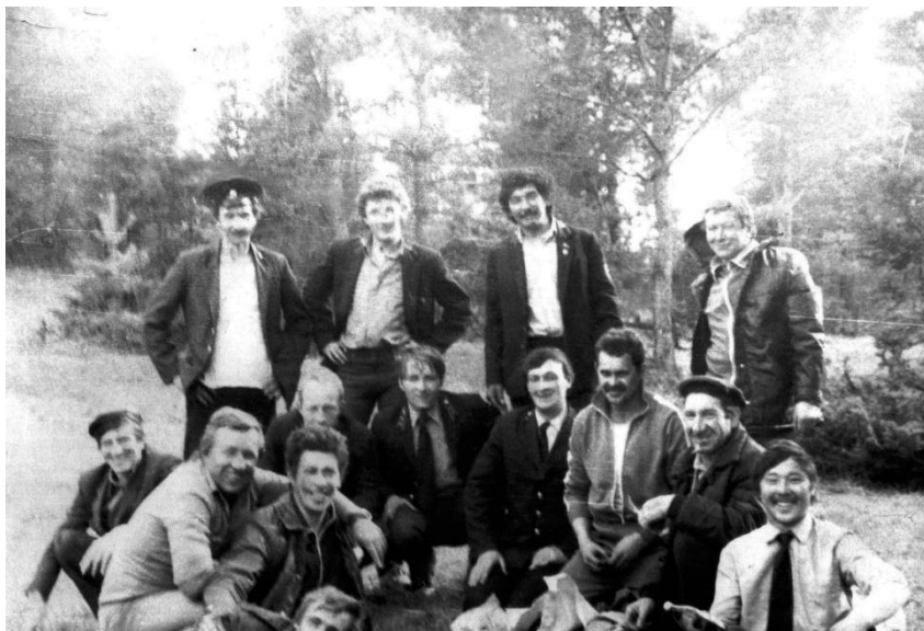
Служба в оперативном взводе 35 ВГСО. 1985 год, г. Салаир