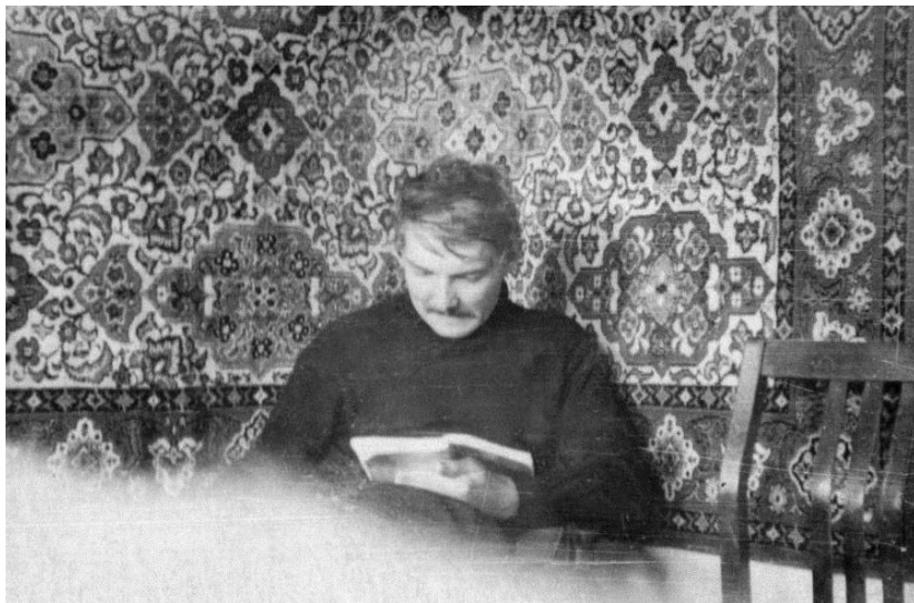
У родителей, читаю. 1987 год, г. Салаир