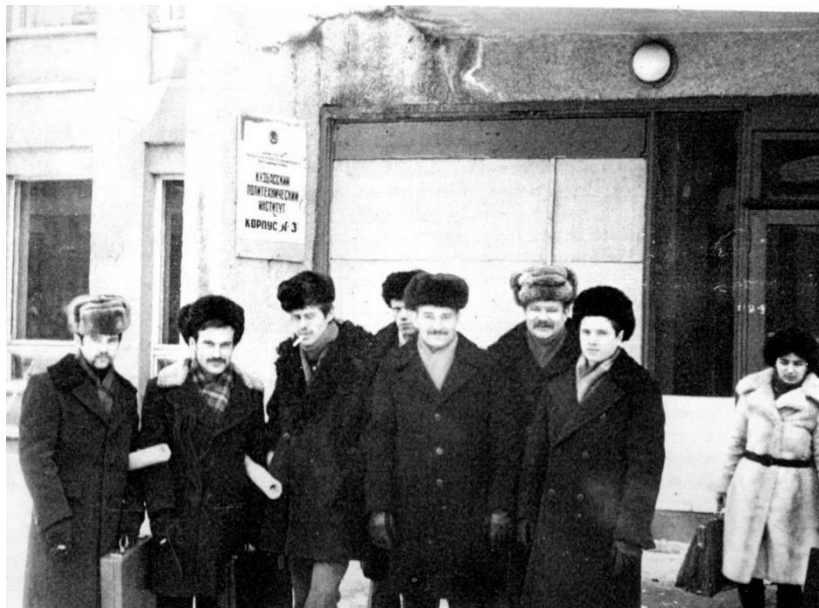
КузПИ, студент горного факультета. 1980 год, г. Кемерово