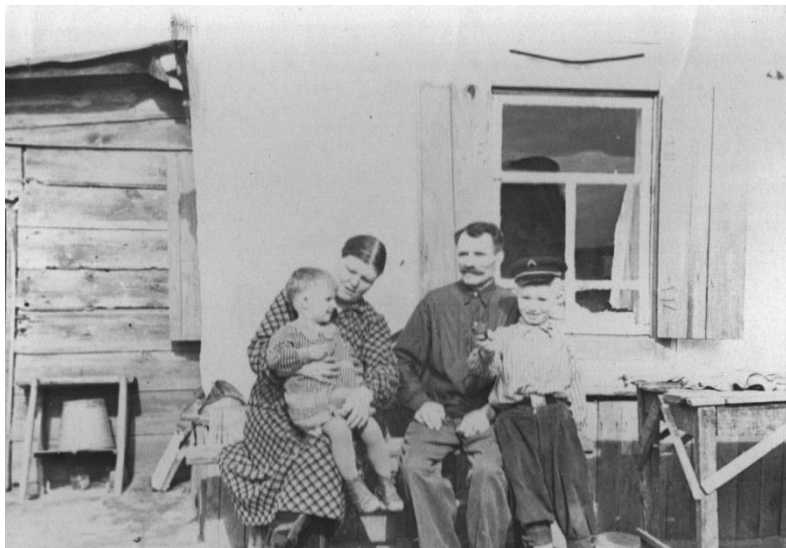
Мои дедушка и бабушка у домика, в котором я родился. 1959 год