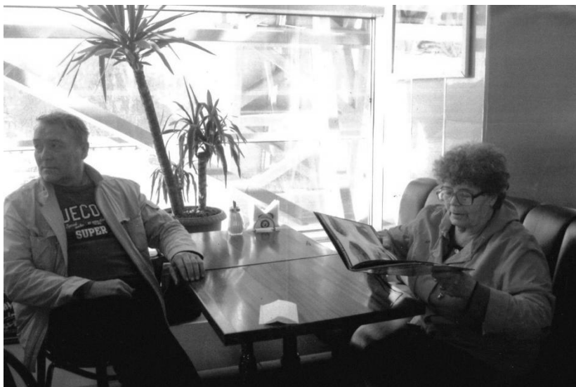
В аэропорту г. Новосибирска с мамой. 2011 год