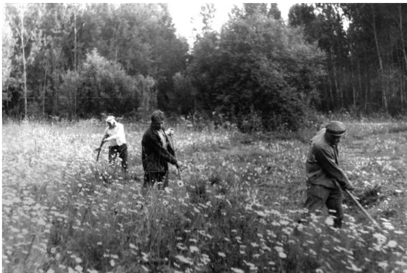
На покосе. 1985 год, г. Салаир.