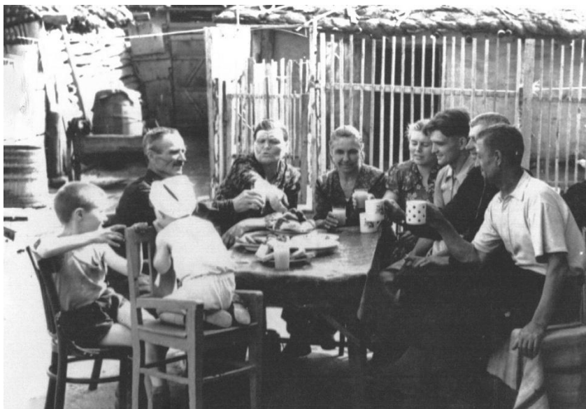
Свадьба моих родителей. 1958 год