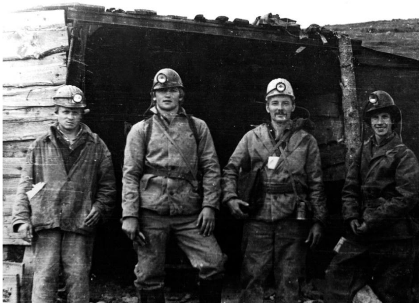
Геологическая экспедиция. Рудник «Центральный».1982 год