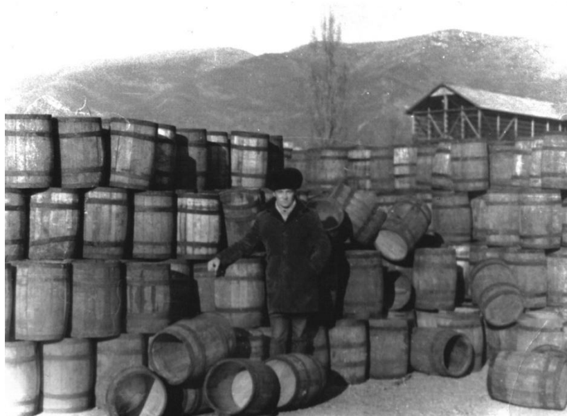
На винзаводе – среди бочек. 1985 год, г. Геленджик