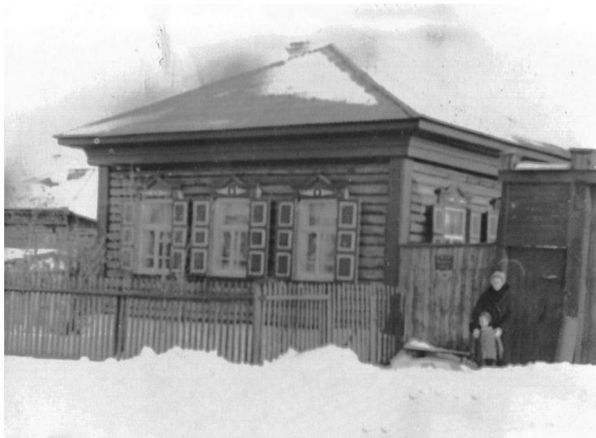
Дом, в котором я прожил свои счастливые 18 лет детства и юности. 1963 год